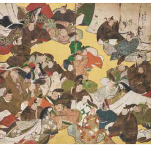
池田孤邨《三十六歌仙図屏風》(通期)

During the 13th century, waka master Fujiwara no Teika collected one hundred poems into a single anthology, each by a different poet. In this Hyakunin Isshu [100 Poets One Poem], the works span verses written from the seventh century to Teika's lifetime. Since the compilation work was carried out while Teika was living on Mt. Ogura, not far from this museum, the collection is known as Ogura Hyakunin Isshu . Sparkling with the wit of a hundred poets, these historical Top 100 poems are recited with affection even to this day.