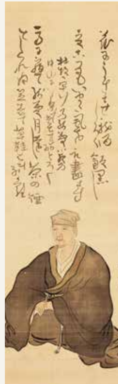
与謝蕪村《松尾芭蕉像》(部分)