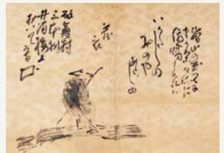
与謝蕪村《「いかだしの」自画賛》(部分)