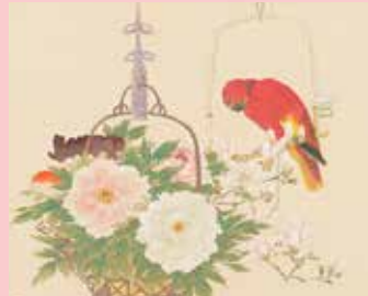
橋本閑雪《麗日図》※部分 前期展示