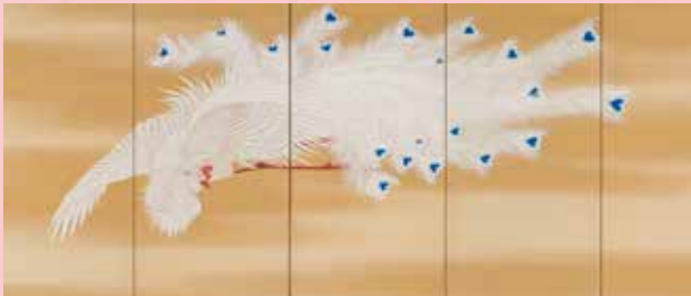
望月玉溪《鳳凰図屏風》(左隻)※部分 通期展示

To make it easy to imagine you are in a traditional bird and flower garden, this show also adds sound, another dimension, to kachōga flower-and-bird painting. Enjoy kachōfūgetsu natural beauty in an extensive exhibition of paintings by artists working during the Edo period (ended 1868) and early modern period. Along with finely rendered plants, see waterfowl, adorable small birds, sleek birds of prey, and more.