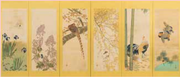
山内信一《十二月花鳥図屏風》(右隻)※部分 後期展示