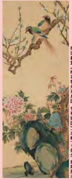
柴田義董《梅花牡丹双鳥図・竹菊猫図》(左幅)※部分 前期展示