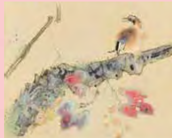
西村五雲《秋翫》※部分 通期展示