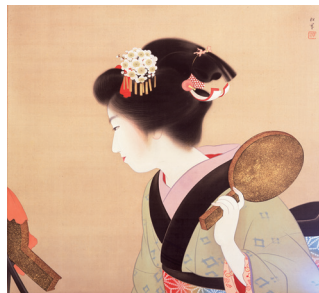
上村松園「鶯壽畫」(前期) 個人蔵