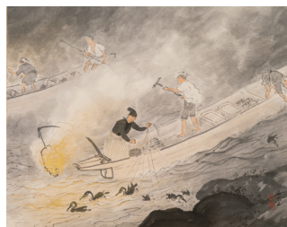
川合玉堂「輪剣」(後期) 福田コレクション蔵