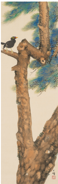
西山翠峰「松寿千年」(後期) 福田コレクション蔵