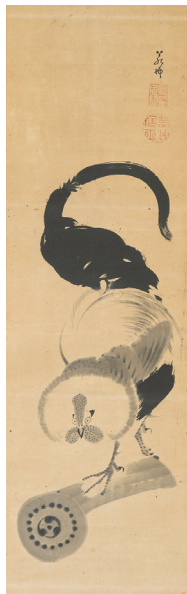
伊藤若冲「瓦に鶏図」(後期) 福田コレクション蔵